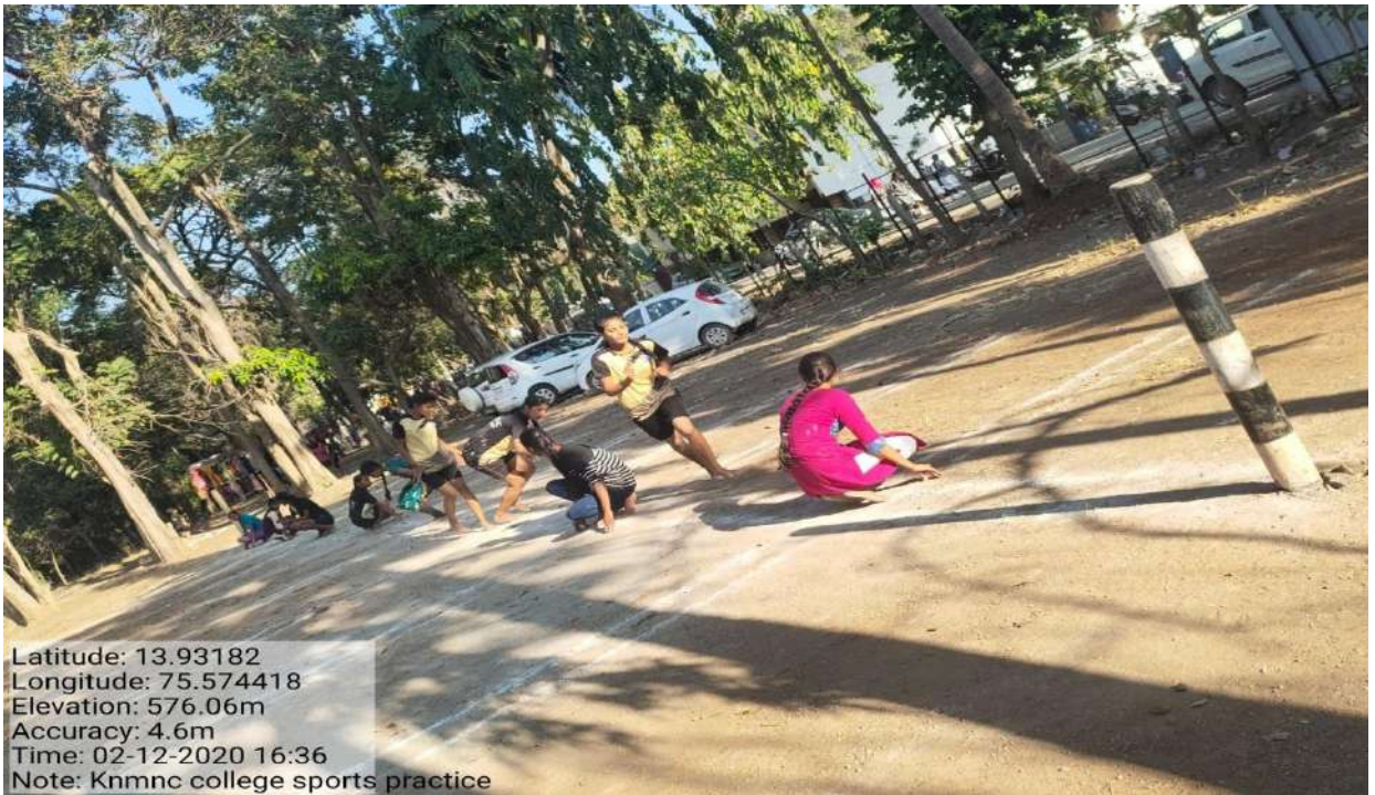
Latitude: 13.93182 Longitude: 75.574418 Elevation: 576.06m Accuracy: 4.6m Time: 02-12-2020 16:36 Note: Knmnc college sports practice