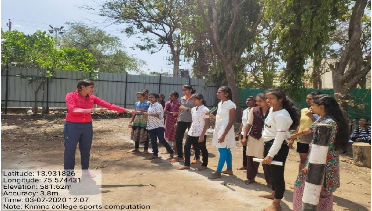
Latitude: 13.931826 Longitude: 75.574431 Elevation: 581.62m Accuracy: 3.8m Time: 03-07-2020 12:07 Note: Knmnc college sports computation