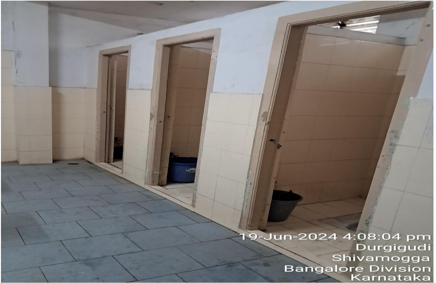
19-Jun-2024 4:08:04 pm Durgigudi Shivamogga Bangalore Division Karnataka