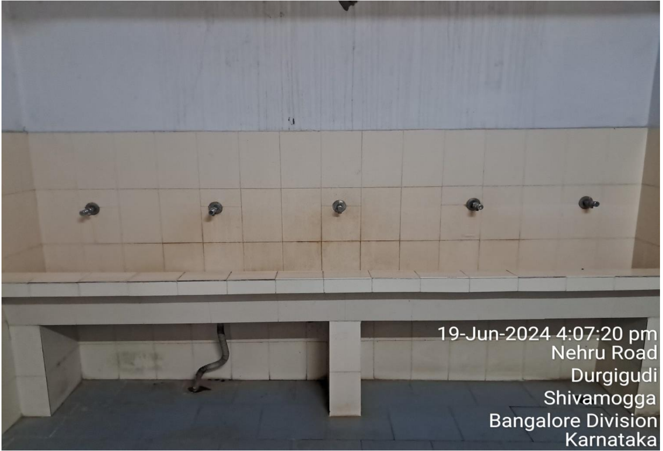
19-Jun-2024 4:07:20 pm Nehru Road Durgigudi Shivamogga Bangalore Division Karnataka